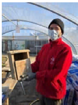
Salomon présente un nichoir