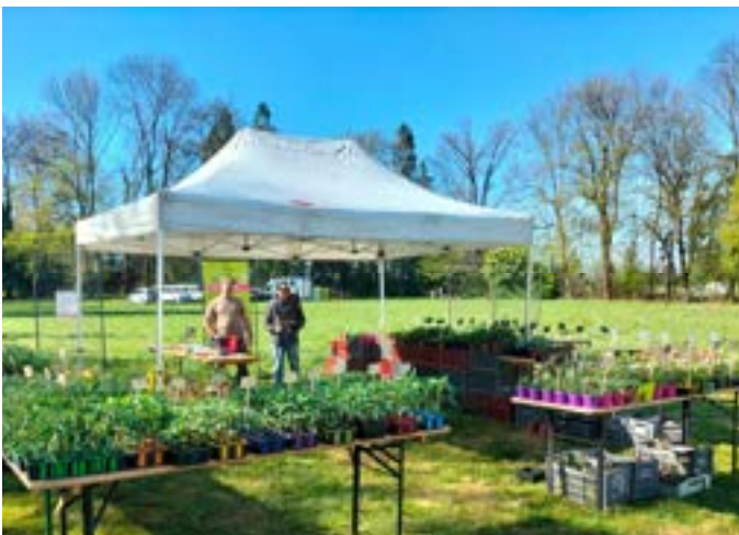
Le stand des Jardins à la Foire de Coublevie (avril 2022)