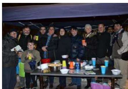
La Soupe Partagée et les bénévoles

Un mardi soir bien gelé, en janvier, dans le cadre du projet « Santé, bien-être dans son assiette », les résidents de la Pension de Famille et du Logis