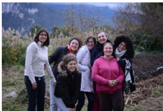
Les Jeunes de l'IM Pro Echirolles