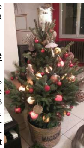
Le sapin vainqueur du concours du plus beau sapin!