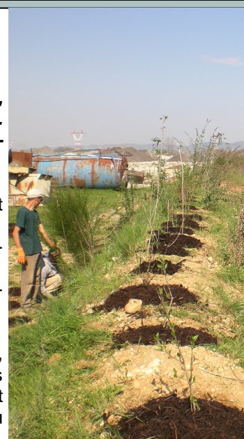
Les arbustes replantés au printemps

La première phase des travaux a consisté au creusement de trous de plantations, dans des terrains très caillouteux (carrière), puis apport de compost, pralinage des racines des plants (boue de compost et de terre qui permet d'éviter le dessèchement des racines et améliore la reprise des arbustes) et plantation puis paillage avec du broyat (première phase de décomposition de branches).