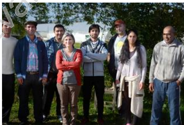
Groupe de FLE avec leur professeure

Depuis le 23 septembre, des cours de français langue étrangère sont dispensés aux Jardins. Les salariés ayant des difficultés avec la langue viennent tous les vendredis pour 7h de cours, et ce sur 10 semaines, pour arriver à un total de 70h de français.