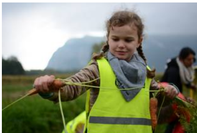
Atelier ramassage de carottes

Mardi 11 octobre, pour la semaine du goût et malgré le vent et le froid, une classe de CP de l'école primaire de Voiron est venue nous rendre visite aux Jardins pour une matinée. Divisés en quatre groupes, les enfants ont pu tour à tour faire quatre activités différentes. Premièrement, avec Marcel (un salarié) et Lise (Animatrice réseau), les enfants sont allés ramasser des carottes. Avec leur maîtresse ainsi qu'avec des parents d'élèves, ils ont pu