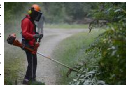
Débroussaillage d'un sentier

Cette nouvelle saison donne aussi l'occasion aux 8 salariés de cette équipe de réaliser davantage de formations individuelles ou même des stages. Par exemple, trois salariés étaient présents à la formation maçonnerie paysagère, et presque toute l'équipe était également présente à une formation pour l'entretien du matériel.