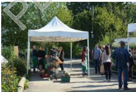
Portes Ouvertes

Les Portes ouvertes se sont magnifiquement bien passées. Vous avez été nombreux et très