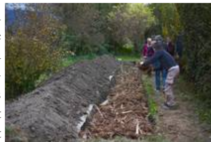
Remplissage de la butte