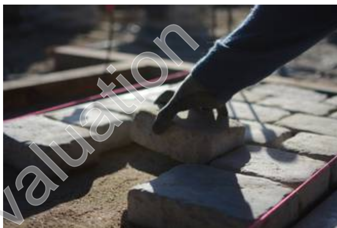
Réalisation d'un chemin de pierres