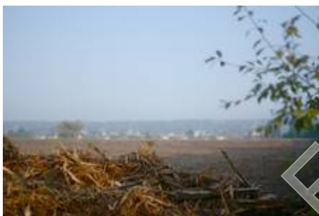
Parcelle déboisée

Cet été, nous avons récupéré une parcelle de 2.7 Hectares. Maintenant déboisée, nous y avons semé de l'engrais vert. Nous en mettrons encore pendant 1 an et demi pour pouvoir ensuite y installer des cultures maraîchères, de façon à répondre à la demande croissante de paniers de légumes.