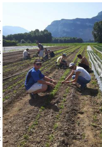
Les 4 salariées de Melvita au désherbage avec les salariés des Nouveaux Jardins