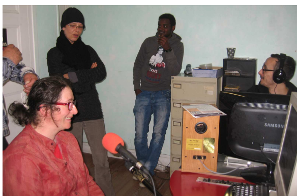
Les salariés lors de l'enregistrement de l'émission à New's FM

En mars ce sont 6 salariés, 1 encadrant technique et la chargée d'insertion qui ont participé à une visite guidée de la salle de spectacle de l'Heure Bleue puis à un atelier de théâtre et d'écriture organisé par la Fabrique des Petites Utopies, une compagnie de théâtre grenobloise.