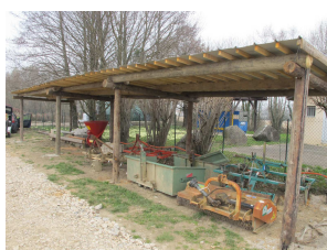
Le hangar matériel

Un abri pour le matériel a également vu le jour en début d'année, réalisé en partie avec du matériel de récupération, et toujours la force de nos bénévoles !