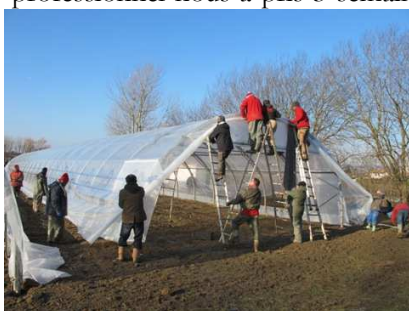
Mise en place du plastique sur les serres

Après la tempête de novembre 2014 qui plia nos 3 serres toutes neuves, nous n'avons pas chômé ! Grâce au remboursement de l'assurance, et au soutien du Conseil Général nous avons pu remplacer ces 3 serres. Le remontage avec un professionnel nous a pris 3 semaines, il fallut également démonter les anciennes serres... Encore beaucoup de travail pour nos salariés et leurs encadrants, avec l'aide précieuse des bénévoles, nombreux à venir nous donner un coup de main.